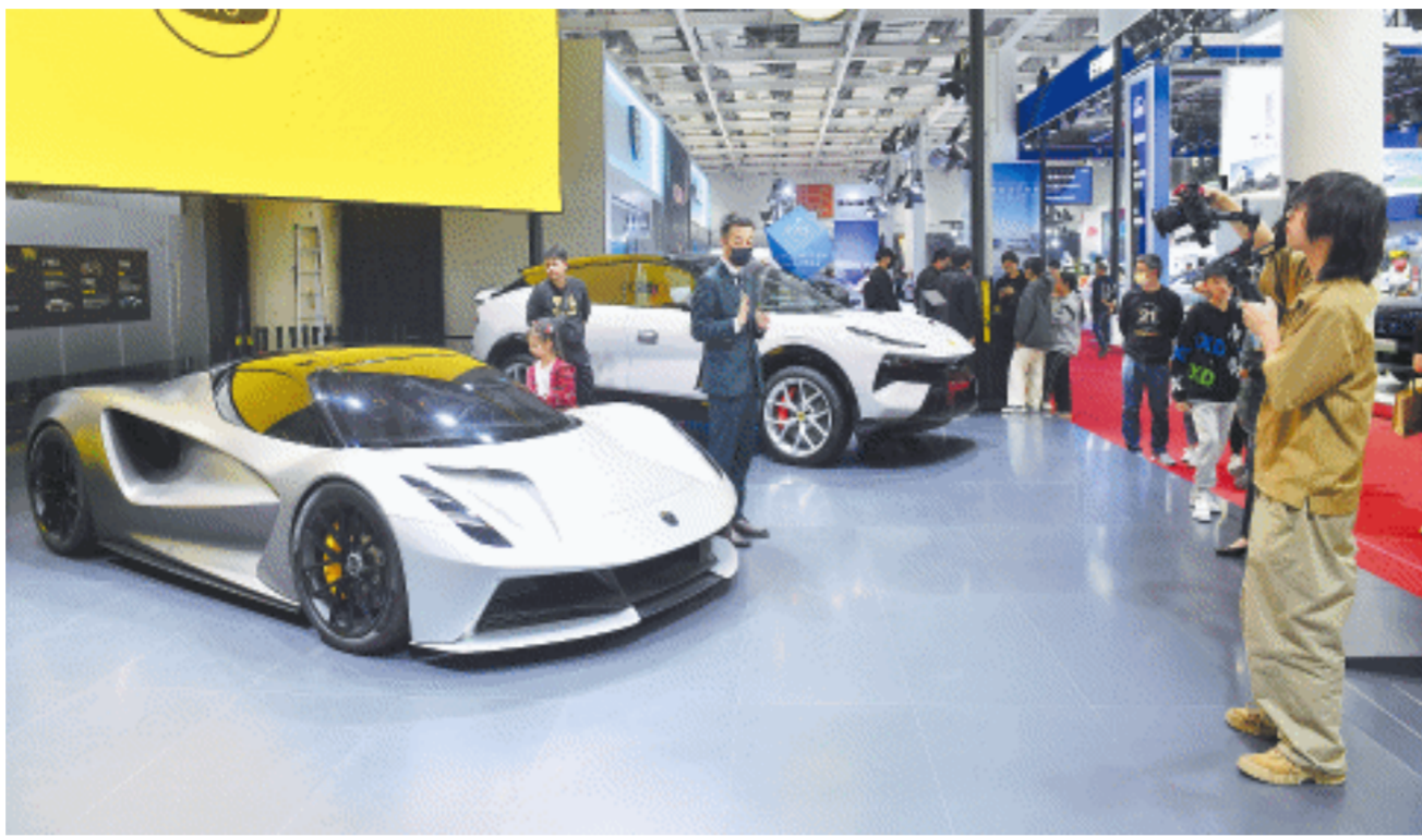
湖南车展的品质不断提升,影响力持续扩大,吸引越来越多的消费者。长沙晚报全媒体记者 邹麟 摄(资料图片)

汽车技术和潮流,大大地促进了车市的繁荣,提升了湖南车市的整体规模和影响力。”邱波说,各参展汽车品牌也通过湖南车展,提升了品牌的知名度和美誉度。