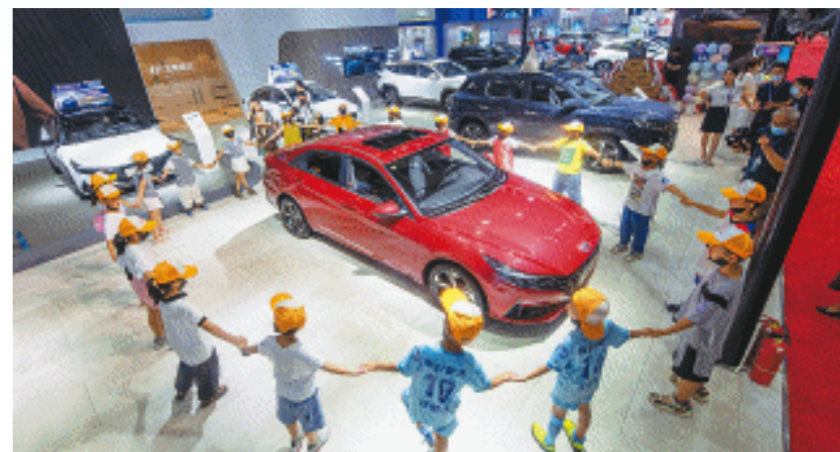
往届湖南车展上,孩子们一起参加“汽车科技体验官”活动。

长沙晚报4月17日讯(全媒体记者 彭放 范宏欢)期盼已久的五一假期即将来临,如果不想去景点赶人潮,怎样让孩子过一个充实有趣又有意义的假期?4月30日至5月5日在湖南国际会展中心举行的2024湖南汽车展览会暨长沙市汽车消费节(简称“2024湖南车展”),将给孩子们提供一个参加社会实践活动、体验汽车科技的好机会。即日起,“汽车科技体验官”五一假期社会实践活动正式开启招募,长沙市中小學生(年龄小于18周岁)均可报名。参与活动并完成社会实践相关内容,即可领取由长沙晚报社、三湘都市报以及湖南省汽车商会联合颁发的《社会实践证书》,参与小主播短视频大赛还有机会赢得奖金和证书。