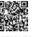
扫码报名参加活动

活动组委会工作人员温馨提示,参与社会实践的学生需由家长或监护人指定监护人(每个孩子有两名监护人可免费参观湖南车展)自行接送;为确保活动顺利开展,建议家长或监护人指定监护人陪同参加,做好防护措施,并为学生拍摄活动照片留档。