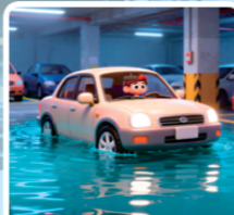
水位刚过脚踝 可以转移车辆