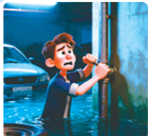
被困传声求救 敲击管道呼援