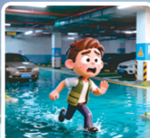
莫贪钱财物 速离绝不折返