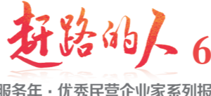
企业服务年·优秀民营企业系列报道