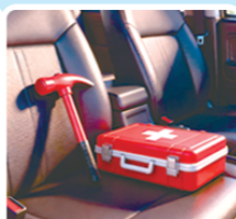
车内常备工具 急时可保命