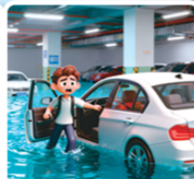
水位迅猛上涨 立刻弃车逃生