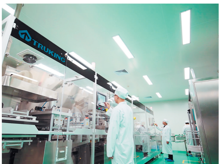
楚天科技26年风雨兼程，一路成长为中国医药装备行业头部企业。图为企业生产车间。