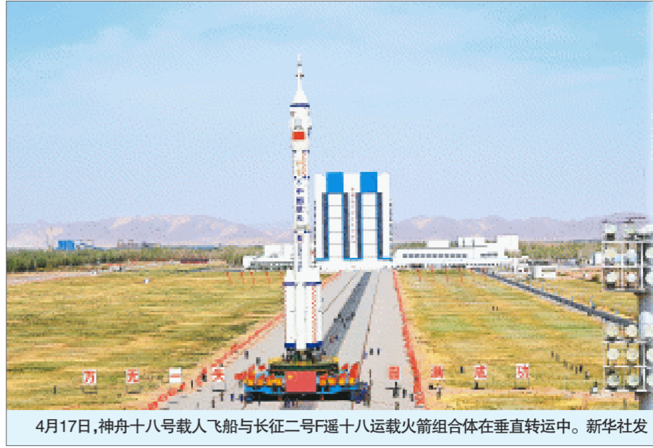
4月17日,神舟十八号载人飞船与长征二号F遥十八运载火箭组合体在垂直转运中。